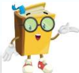
“VIAGGIO NELLA COMPRESIONE DEL TESTO”