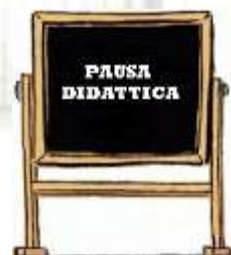
“STOP AND GO!!”