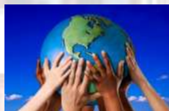
“A SCUOLA DI CITTADINANZA”