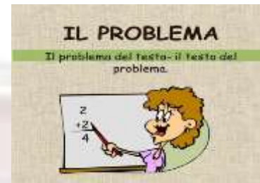
“IL TESTO DEL PROBLEMA”