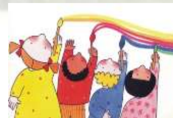
“ATTIVITA' ALTERNATIVA ALLA RC”